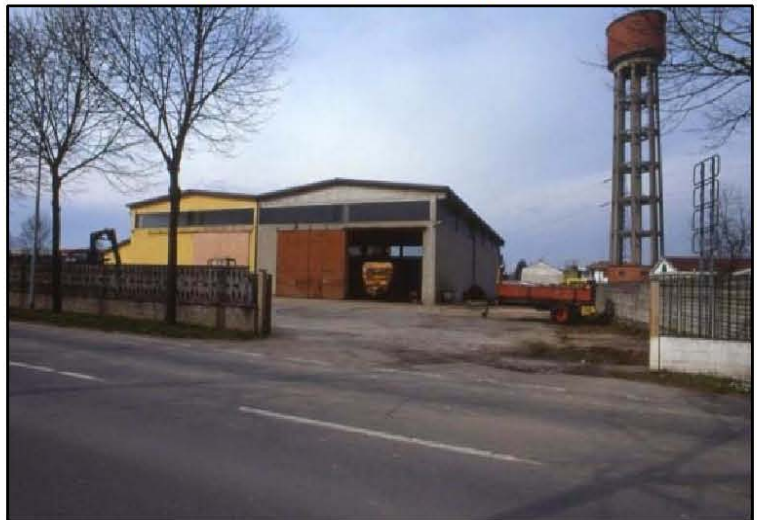
Immagine - depuratore